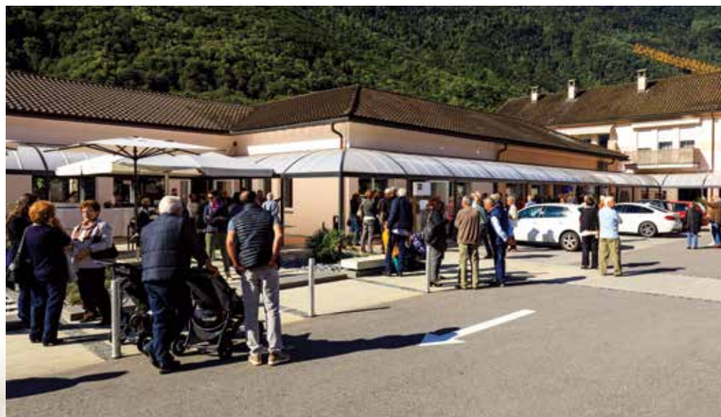
Dall’alto: Plinio Del Notaro Inaugurazione al Centro commerciale La sala gremita alla presentazione del libro a Cevio